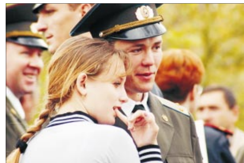
Закон заботится не только об офицерах, но и об их женах.

Кроме того, указанный закон расширяет перечень нестраховых периодов, в связи с зачетом которых в страховой стаж предусмотрено выделение Пенсионному фонду РФ средств из федерального бюджета на возмещение расходов по выплате страховых пенсий за границей и международные организации, перечень которых утверждается Правительством Российской Федерации, но не более пяти лет в общей сложности. Кроме того, указанный закон расширяет перечень нестраховых периодов, в связи с зачетом которых в страховой стаж предусмотрено выделение Пенсионному фонду РФ средств из федерального бюджета на возмещение расходов по выплате страховых пенсий за границей и международные организации, перечень которых утверждается Правительством Российской Федерации, но не более пяти лет в общей сложности.