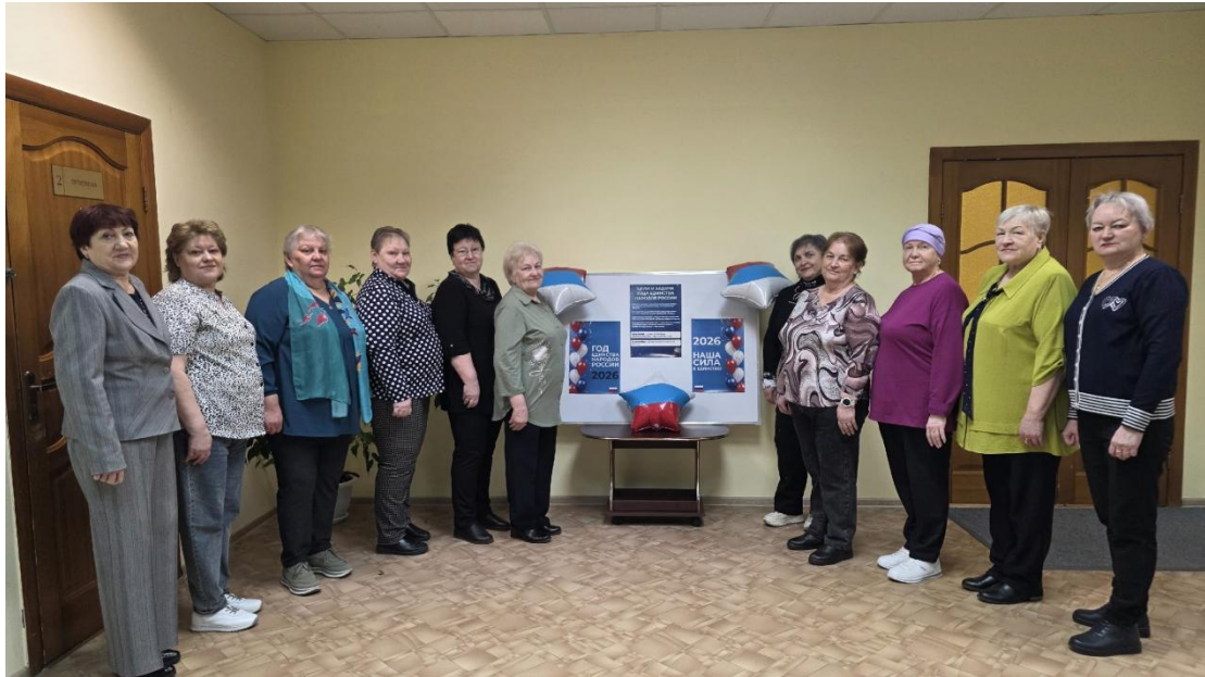
ЦОСП г.Покачи. День коренных малочисленных народов России.