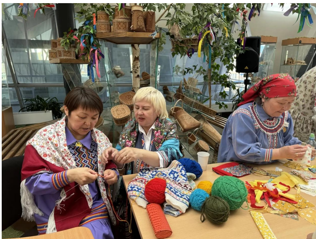
ЦОСП Белоярского района. Этнокультурный центр.