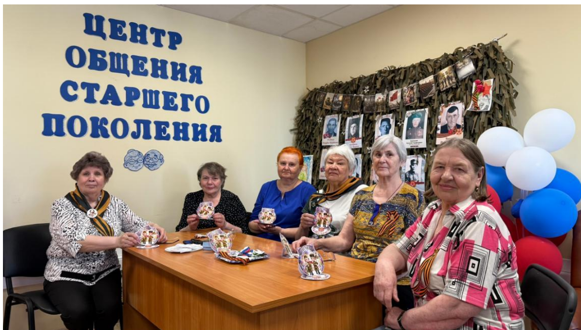
ЦОСП Октябрьского района. Мастер-класс «Я помню. Я горжусь»