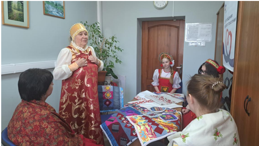
ЦОСП Березовского района. Ярмарка народных промыслов.