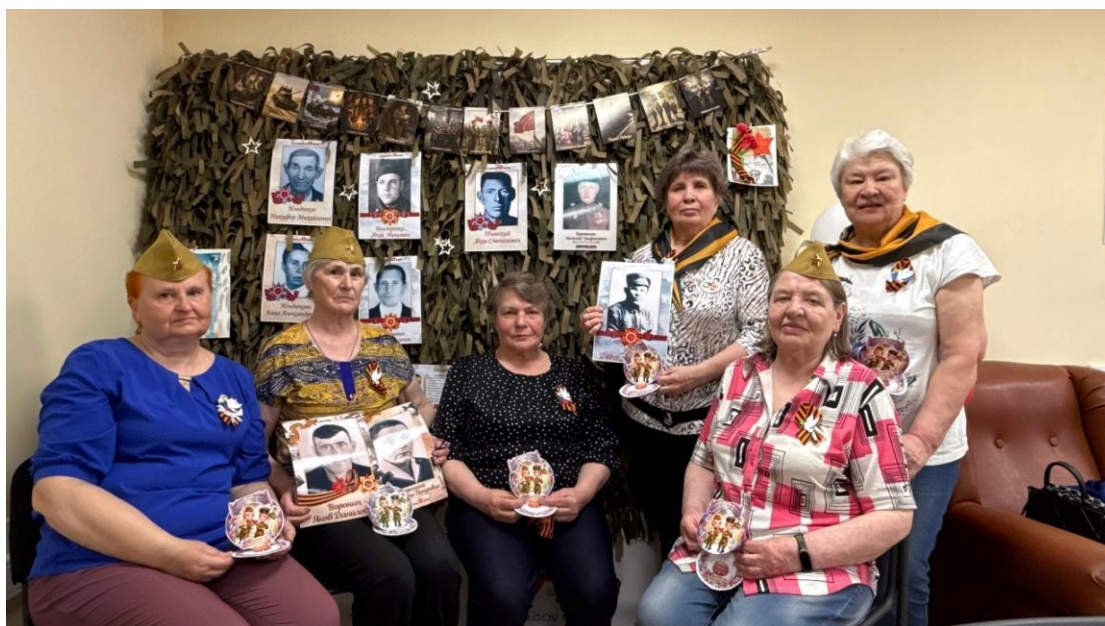
ЦОСП Октябрьского района. Бессмертный полк