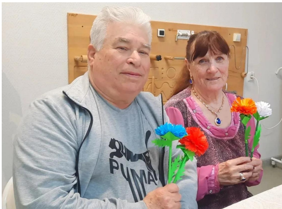
ЦОСП Белярского района. Мастер-класс ко Дню Победы