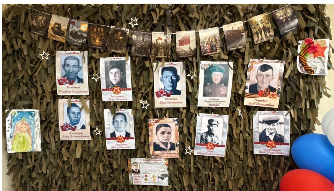
ЦОСП Октябрьского района. Бессмертный полк