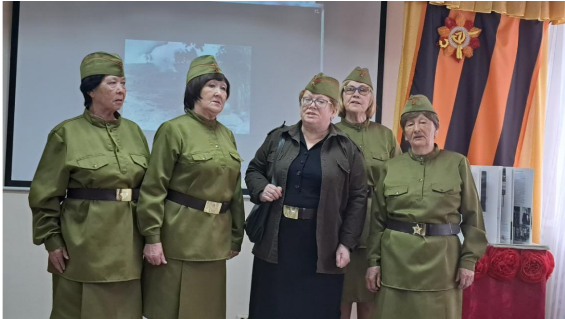
ЦОСП Березовский район. Мини-спектакль о женщинах в годы войны