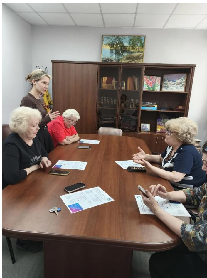
ЦОСП г.Нижневартовск. «Мой друг компьютер».