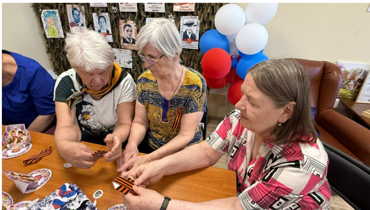
ЦОСП Октябрьского района. Мастер-класс «Я помню. Я горжусь»