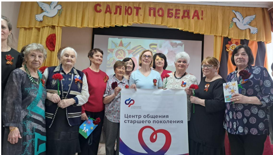
ЦОСП Березовский район. Мини-спектакль о женщинах в годы войны