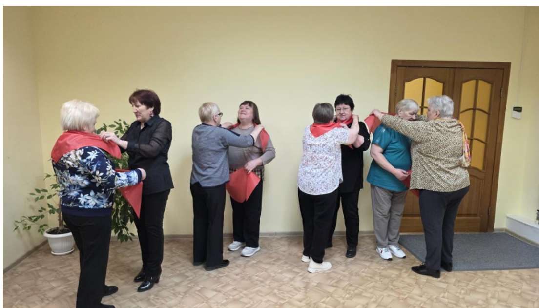
ЦОСП г.Покачи. День пионерии