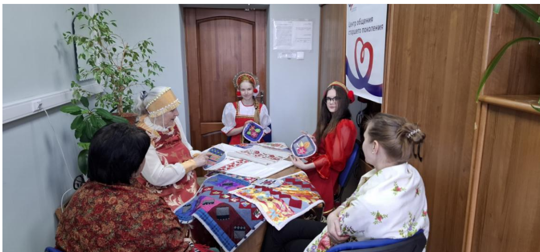
ЦОСП Березовского района. Ярмарка народных промыслов.