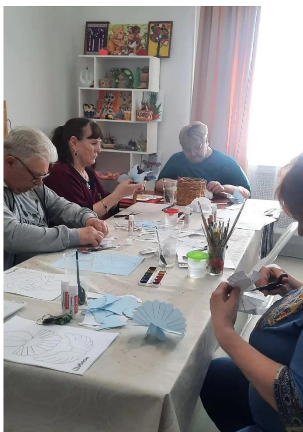
ЦОСП Белярского района. Мастер-класс ко Дню Победы