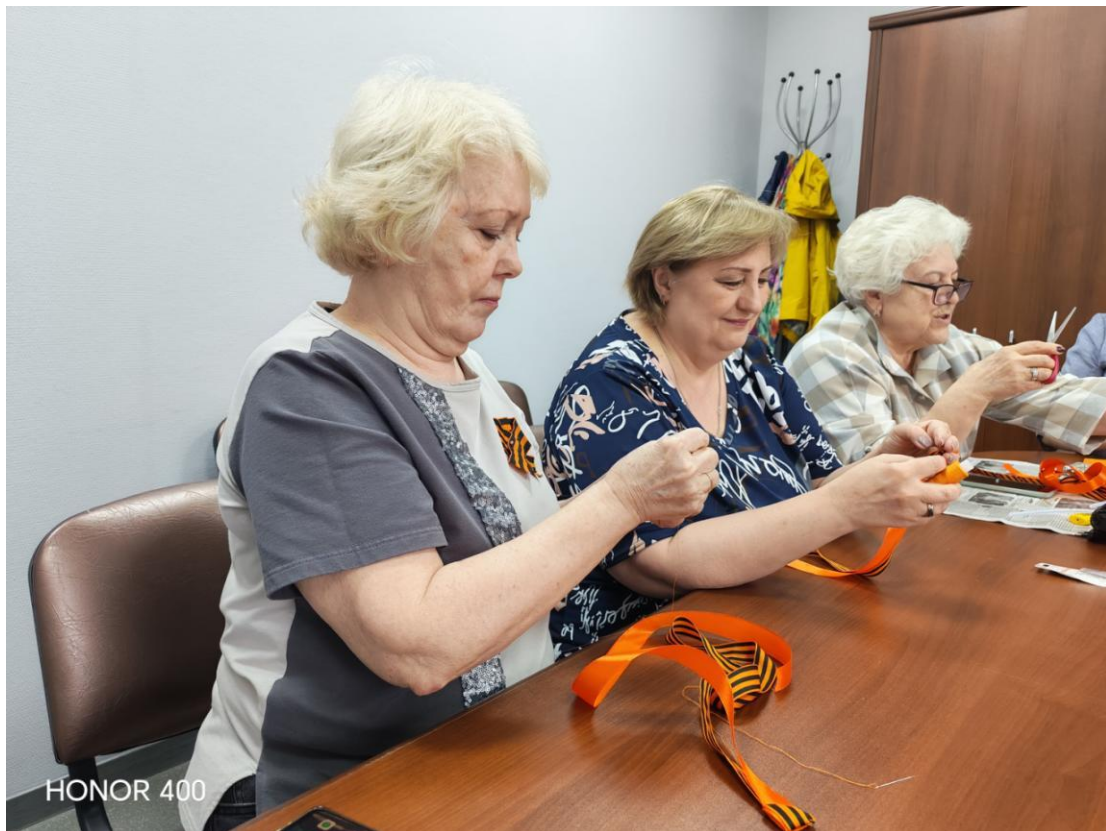
ЦОСП г.Нижневартовск. Мастер-класс «Победная брошь»