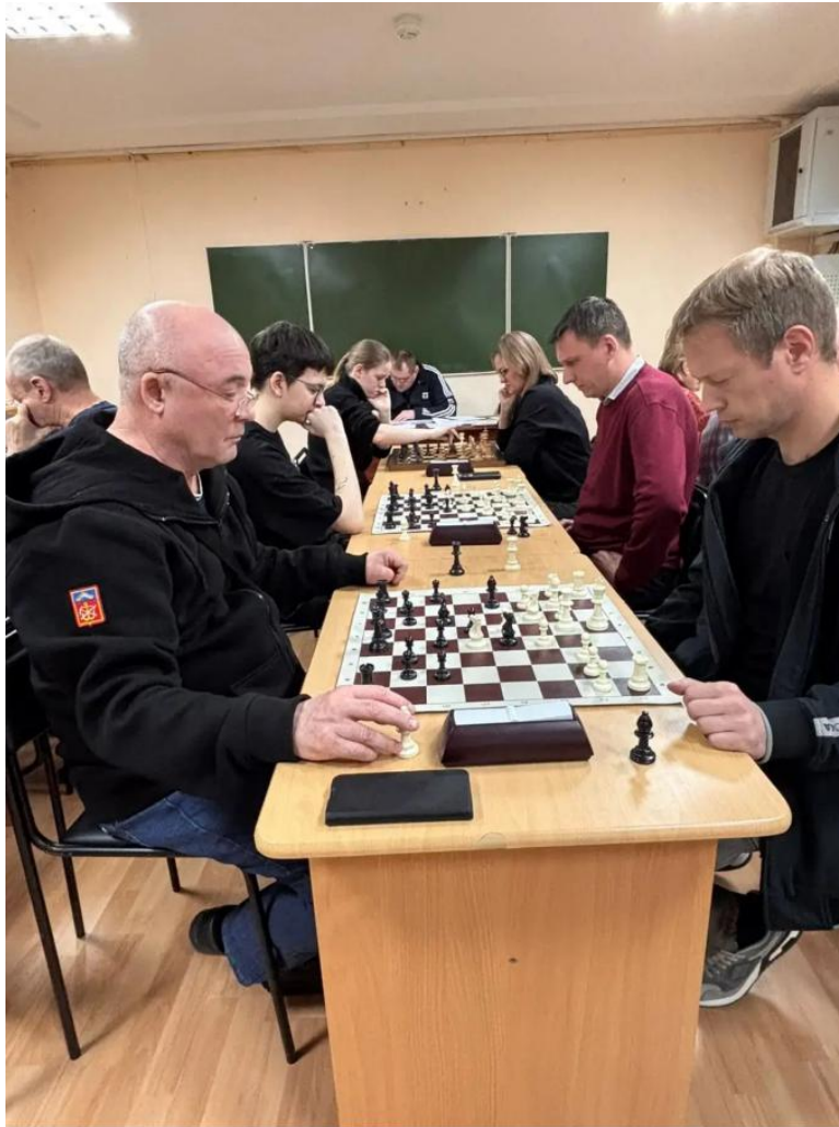
ЦОСП Белярский район. Турнир по шахматам ко Дню Победы