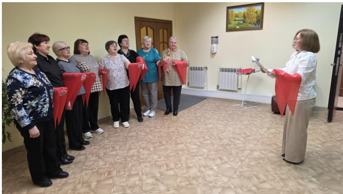
ЦОСП г.Покачи. День пионерии