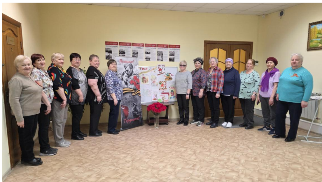
ЦОСП г.Покачи. Встреча «Военные истории»