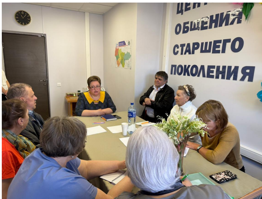
ЦОСП г.Мегион. Лекция по пенсионной грамотности.