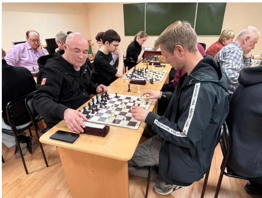
ЦОСП Белярский район. Турнир по шахматам ко Дню Победы