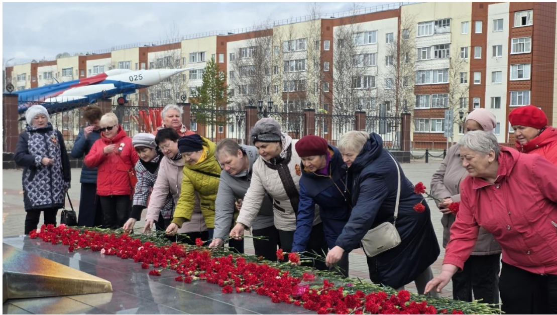
ЦОСП г.Покачи. Возложение цветов к мемориалу День Победы