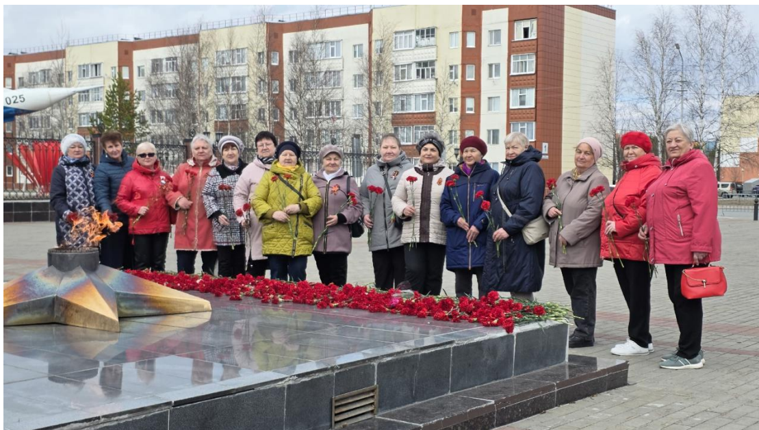
ЦОСП г.Покачи. Возложение цветов к мемориалу День Победы