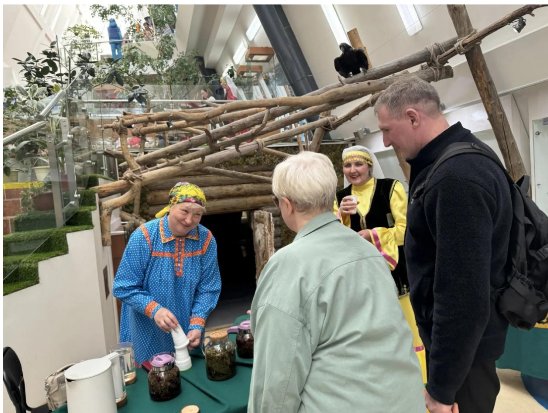
ЦОСП Белоярского района. Этнокультурный центр.