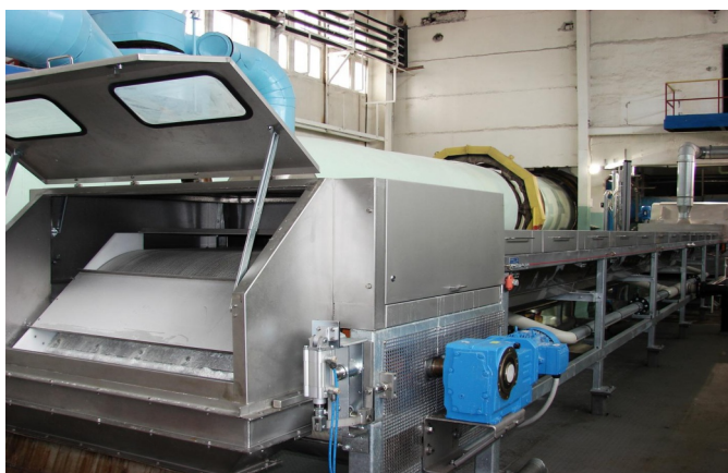
В цехах предприятия.

ством агрохимической продукции, но и заботой о людях, работающих здесь, в том числе и об их пенсионном будущем.