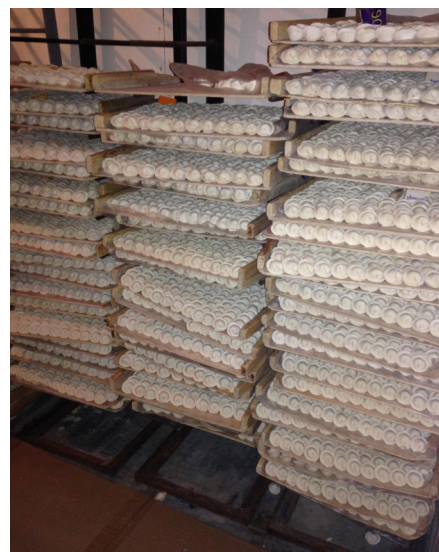
Пельмени от ИП Часовских невероятно популярны.

Предприятие по изготовлению мясных полуфабрикатов создано в мае 1998 года. Вся продукция изготавливается из сырья местных фермерских хозяйств и пользуется большим спросом. Ассортимент и география поставок готовой продукции постоянно расширяются. Сегодня пельмени «Русские говяжьи», «Крестьянские», «Таежные манты» можно увидеть на прилавках Буя и Костромы, Мантурова и Вологды. Текучести кадров на предприятии нет, коллектив сплоченный, очень дружный, каждый дорожит своей работой.