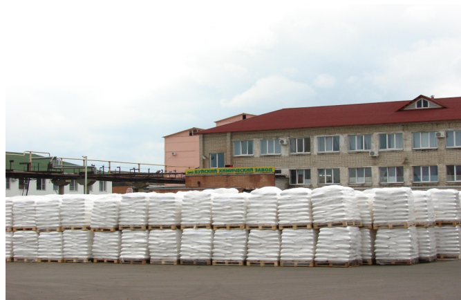
Буйские удобрения известны не только в России, но и в странах ближнего зарубежья.