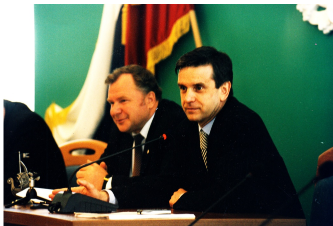
Губернатор Костромской области В.А.Шершунов и Председатель Правления ПФР М.Ю.Зурбов подписывают Соглашение о передаче полномочий по назначению и выплате государственных пенсий от отделов соцзащиты Пенсионному фонду РФ. Май 2001 года.

К концу 1991 года была полностью сформирована служба уполномоченных Пенсионного фонда РФ в Костромской области и сформирован реестр