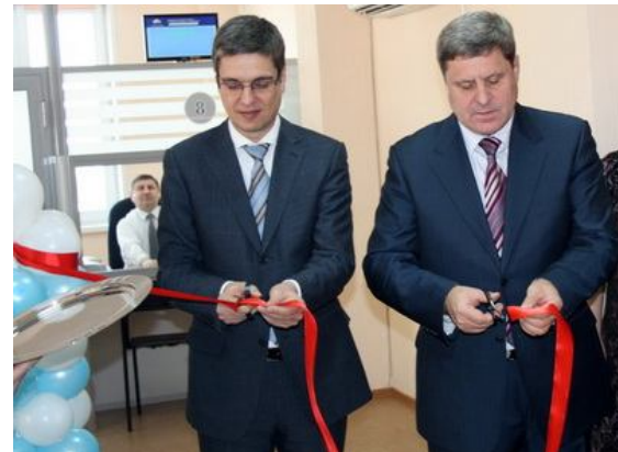
Торжественное открытие клиентской службы для страхователей в Октябрьском районе

Тенденция сегодняшнего времени предполагают предоставление услуг, в том числе и государственных услуг, в единой форме во всех учреждениях с использованием технологических достижений с тем, чтобы сделать процесс получения услуги клиентом не только более быстрым и доступным, но и достаточно комфортным. К этой цели стремится и Отделение ПФР по Новосибирской области, создавая комфортные и современные условия в клиентских службах своих территориальных управлений.