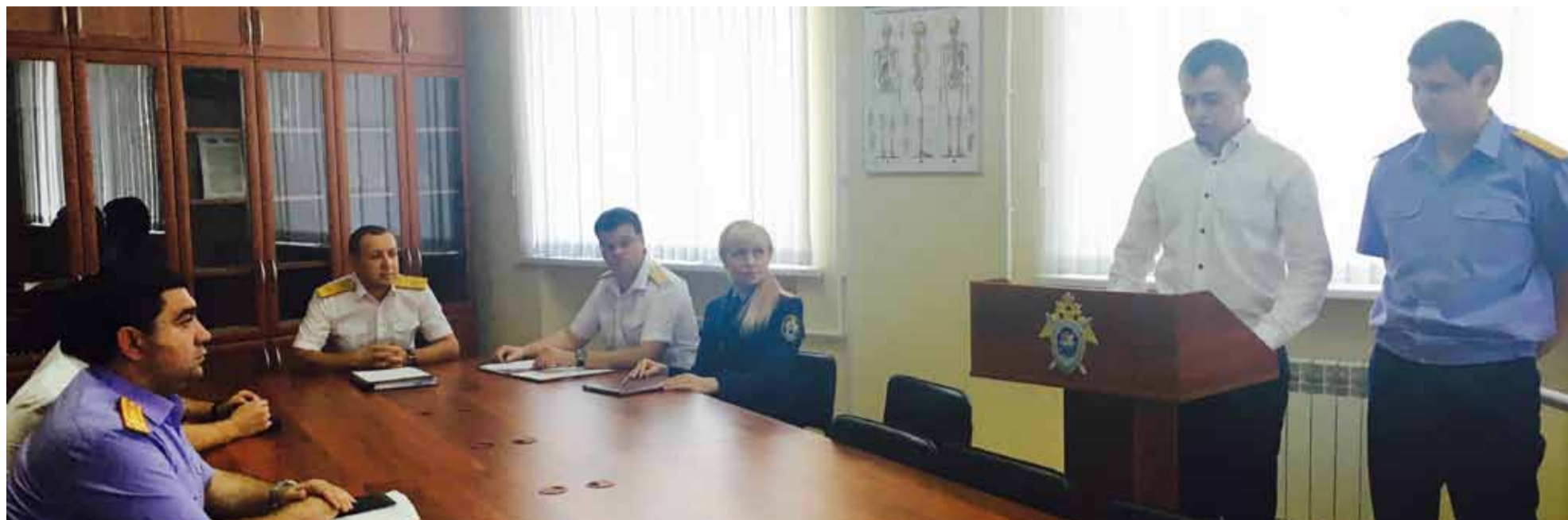
Особое внимание аттестационная комиссия акцентировала на рассмотрении первичной аттестации молодого специалиста – следователя Буденовского межрайонного следственного отдела.