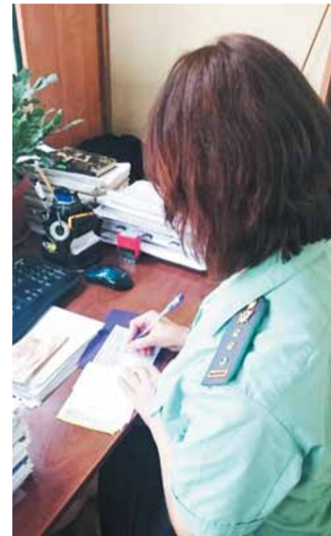
Судебный пристав спецотдела по алиментам взыскал 80-тысячный долг.