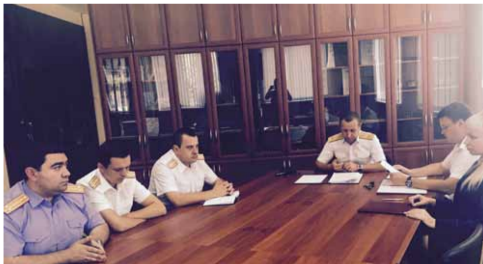
Деятельность аттестационной комиссии положительно сказывается на работе с кадрами.

Председатель аттестационной комиссии следственного управления Следственного комитета Российской Федерации по Ставропольскому краю генерал-майор юстиции Игорь Николаевич Иванов провел заседание аттестационной комиссии следственного управления.