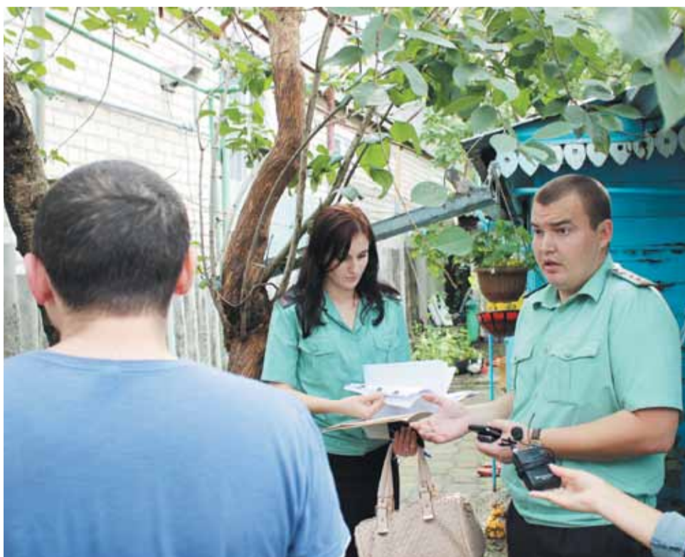
Рейд судебных приставов спецотдела по алиментам в рамках акции «Собери ребенка в школу».

которые работники Службы применяют в его отношении, не действуют.