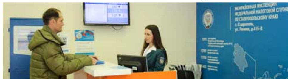
Налоговую декларацию по форме 3-НДФЛ можно подать лично, а можно воспользоваться личным кабинетом налогоплательщика или направить по почте.

23 и 24 марта налоговая служба провела первый этап всероссийской акции «Дни открытых дверей», посвященной декларационной кампании по итогам 2017 года.