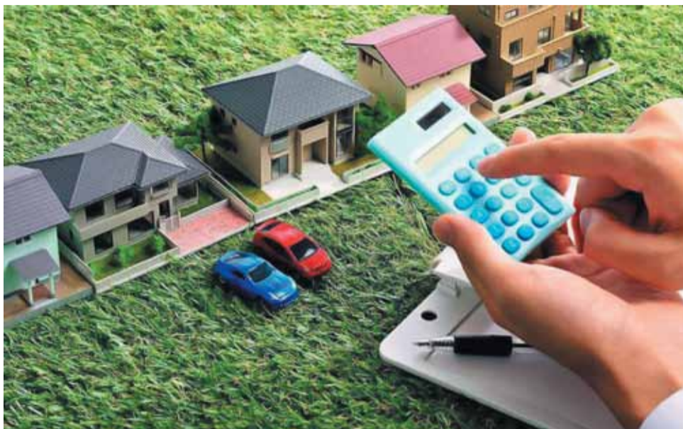
Налоговые ставки по земельному налогу устанавливаются нормативными правовыми актами представительных органов муниципальных образований.

В связи с применением за налоговый период 2017 г. по земельному налогу «федерального» налогового вычета на величину кадастровой стоимости 600 кв.м площади земельного участка, в т.ч. для налогоплательщиков-пенсионеров, возникла необходимость в разъяснении постановлений органов местного самоуправления, которыми может предусматриваться дополнительные льготы. Например, одним их муниципальных образований была установлена следующая льгота: «Налоговая база, уменьшенная для определенных категорий налогоплательщиков, в соответствии с п. 5 ст. 391 Налогового кодекса Российской Федерации на территории муниципального образования дополнительно уменьшается на сум-