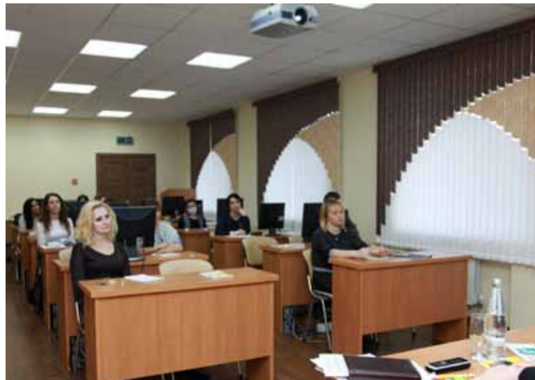
Участники рабочей группы поделились опытом работы по финансовой грамотности.