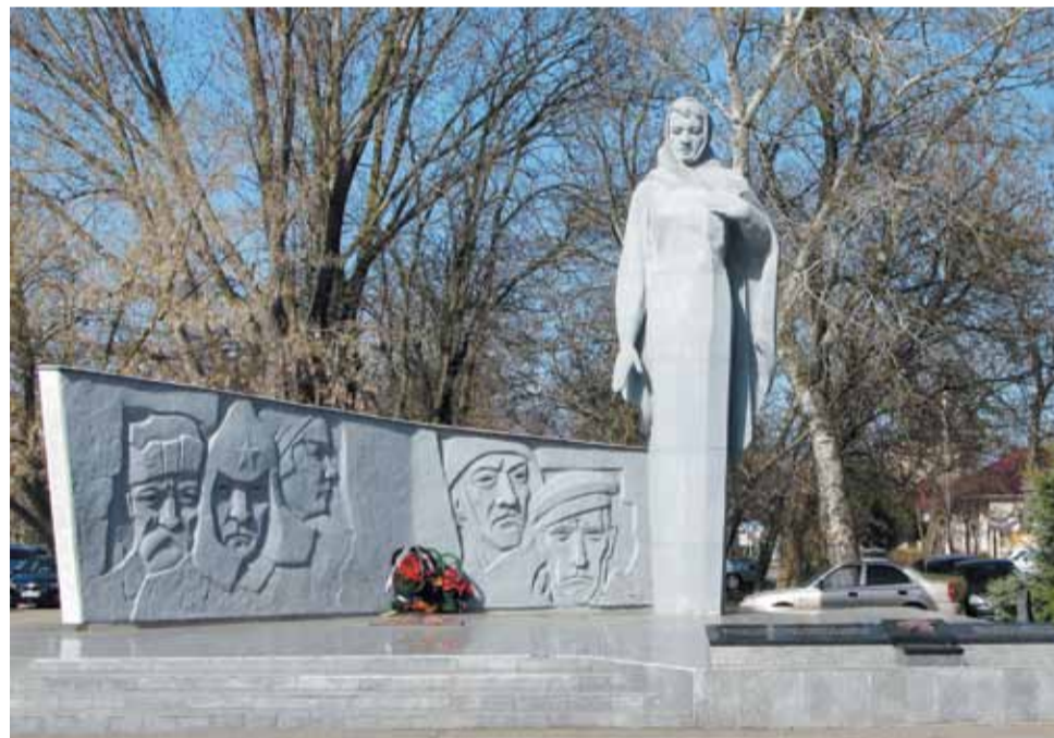
Памятник «Мать-Родина», г. Будённовск.

Ни один населенный пункт Ставропольского края не обошла война. Сегодня в каждом районе края десятки мемо-