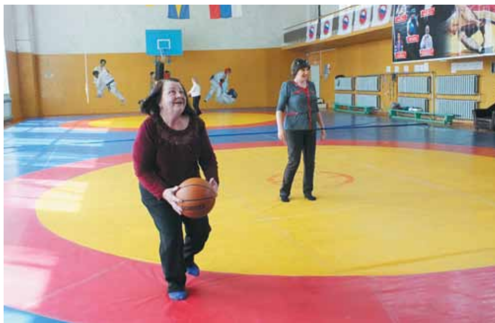
Ветераны с азартом участвовали в соревнованиях.