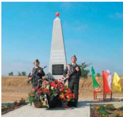
Обелиск «Неизвестному солдату».

Во время Великой Отечественной войны город Кисловодск, как и все города