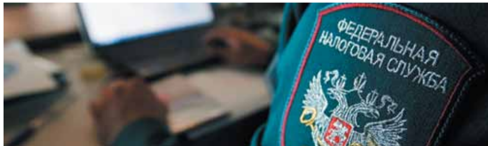
То что, по мнению налогоплательщика, является налоговой оптимизацией, на деле оказывается схемой ухода от налогообложения.

Налоговики Ставропольского края нацелили свои усилия на борьбу со схемами ухода от налогообложения.