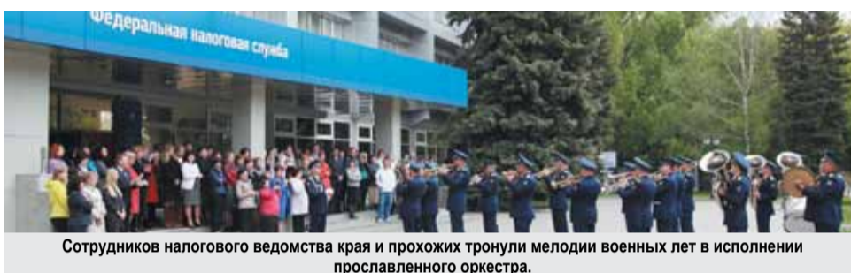
Сотрудников налогового ведомства края и прохожих тронули мелодии военных лет в исполнении прославленного оркестра.