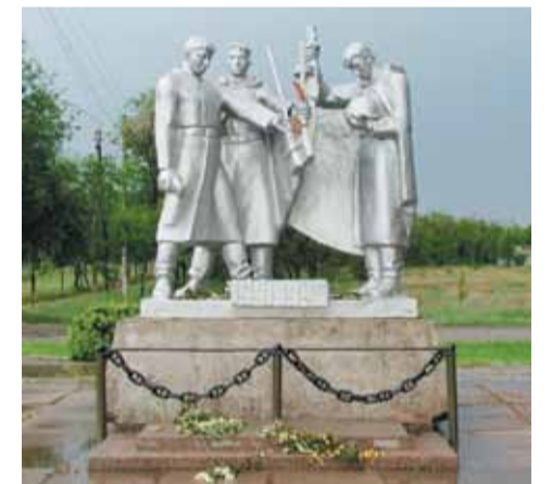
Памятник Славы Воинам Освободителям 4-го Кубанского корпуса, г. Нефтекумск.