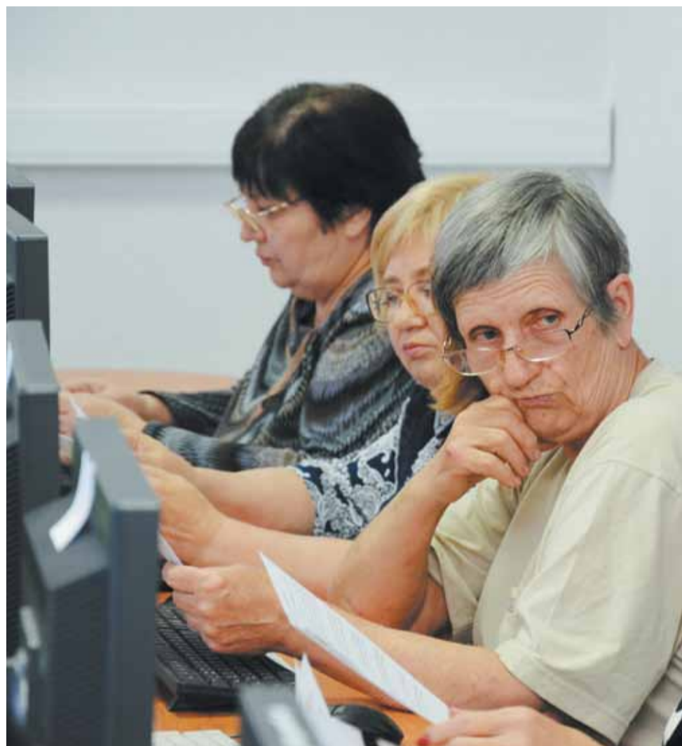
Участники турнира обдумывают задания.