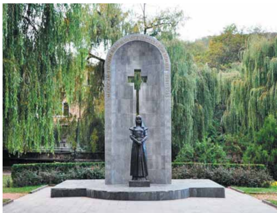
Памятник медикам ВОВ 1941–1945 годов, г. Кисловодск.

Кавказских Минеральных Вод, со своими санаториями и лечебницами превратился в госпиталь. Только в сентябре 1943 года город смог принять 21 897 раненых и больных, а к середине октября здесь уже находилось на излечении более 49 тысяч бойцов, и с каждым месяцем эта цифра увеличивалась. Благодаря самоотверженной работе медиков в строй было возвращено около 60 тысяч воинов.