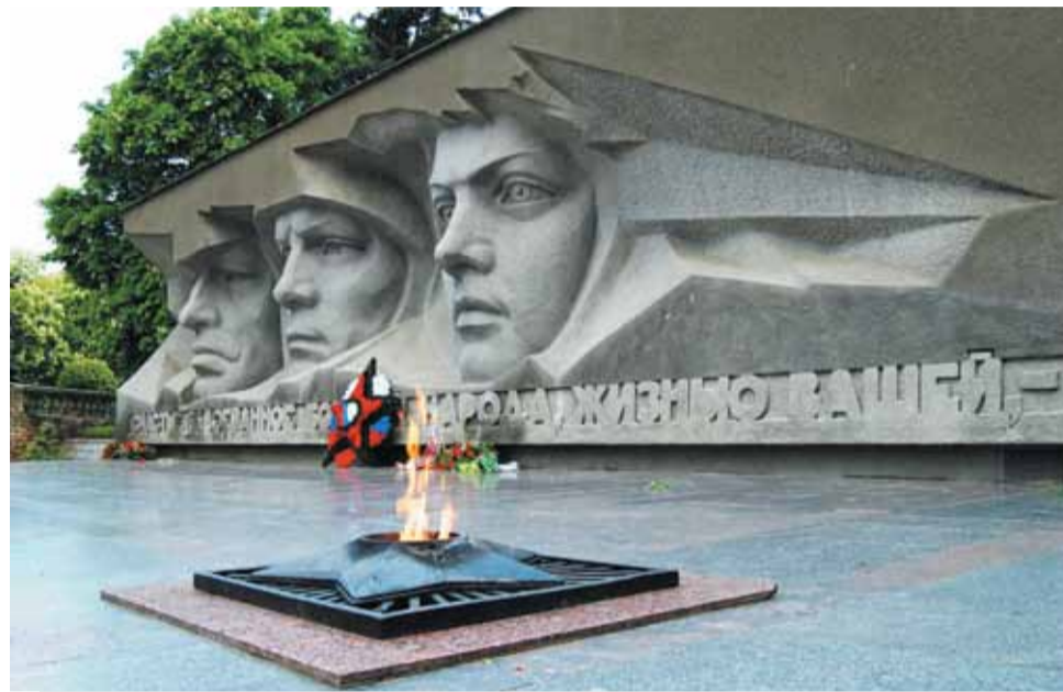
Мемориал «Огонь вечной славы», г. Ставрополь.

Государственная регистрация прав и сделок с объектами культурного наследия имеет ряд особенностей и проводится с учетом положений Федерального закона от 25.06.2002 № 73-ФЗ «Об объектах культурного наследия (памятниках истории и культуры) народов Российской Федерации». Памятники и мемориалы Победы относятся к объектам культурного наследия.