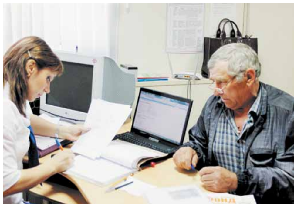
Специалист ведет прием в здании администрации с. Гофицкого Петровского района Ставропольского края.