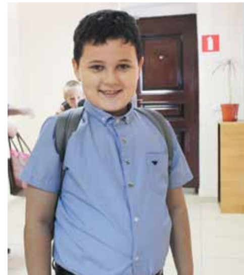
Полосу подготовила Юлия Ивакина