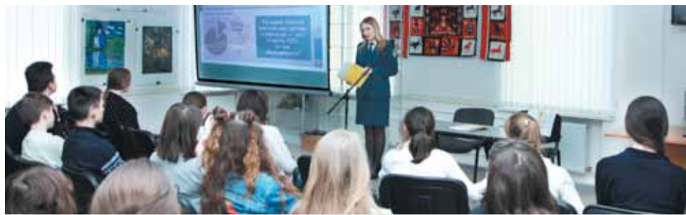
Юные художники оказались неплохими математиками и знатоками логики, легко справляясь с практическими налоговыми задачами.

22 марта юные художники Ставрополя познакомились с основными понятиями налогообложения. Сотрудники УФНС России по Ставропольскому краю рассказали о подачах и сборах разных стран и эпох, предложили ребятам самим попробовать себя в роли законодателей и придумать новый налог. Дети успешно «перевоплотились» в депутатов думы, а потом и в налогоплательщиков, обдумав аргументы за и против введения нового налога.