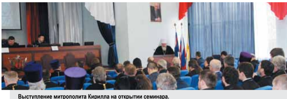
Выступление митрополита Кирилла на открытии семинара.