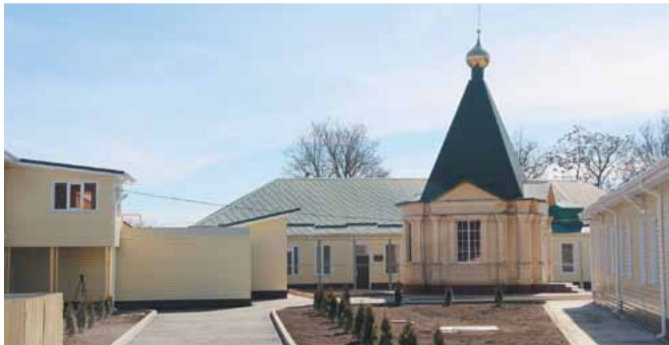
Территория ИЦ-1 УФСИН России по Ставропольскому краю.

Исправительный центр № 1 УИС Ставрополя вызвал всплеск профессионального интереса со стороны журналистов. Свои видеосюжеты, интервью и статьи в эфире телеканалов и на страницах печатных изданий и их интернет-версий показали и опубликовали, как местные средства массовой информации, так и федеральные. ИЦ-1 УФСИН России по Ставропольскому краю расположен в г. Георгиевске и рассчитан на 144 осужденных. На конец первого квартала в учреждении содержатся 7 осужденных, приговоренных к сроку от 6 месяцев до 2,5 лет принудительных работ. Все они трудоустроены: