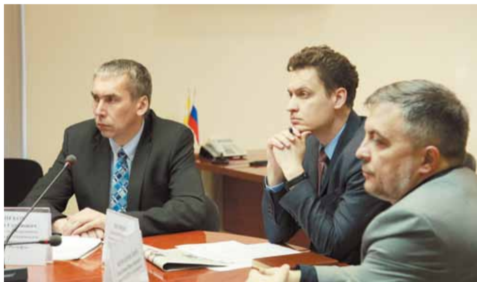
Представители бизнес-сообщества обсудили с членами совета и экспертами центров технического обслуживания проблемы перехода на онлайн-кассы.