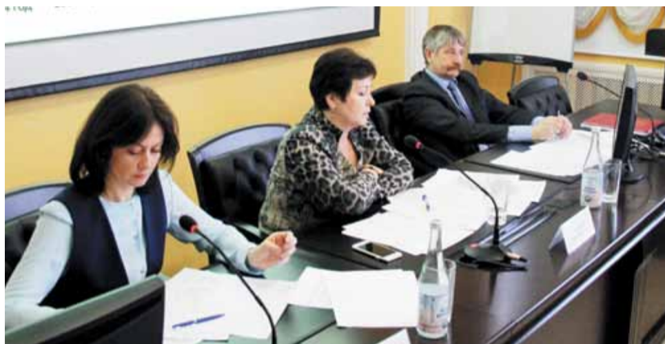
Участники межведомственной комиссии предлагают скоординировать усилия налоговых органов, местных администраций и судебных приставов для сохранения позитивного тренда поступлений в бюджет.