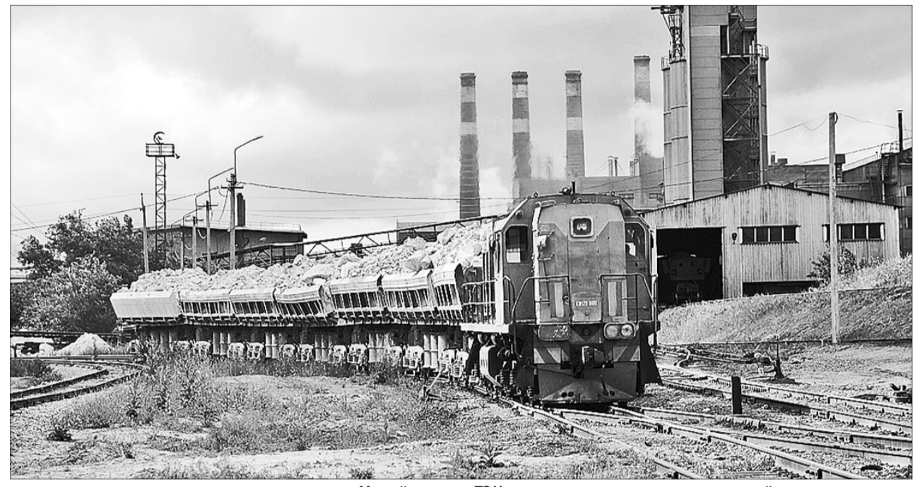
Михайловская ТЭЦ может стать локомотивом местной промышленности

В соответствии с действующими критериями очередности оказания поддержки проблемным муниципалитетам у этой группы городов средние шансы на получение помощи – в приоритете первая категория «с наиболее сложным социально-экономическим положением». Однако, по данным ФРМ, на конец мая заключено только девять соглашений о совместной реализации комплексных проектов по развитию 11 моногородов, а также подписано три соглашения о софинансировании. Предполагается, что новая стратегия ФРМ позволит в разы увеличить число моногородов, с которыми фонд начнет работу в 2015 году, увеличит и плановое привлечение инвестиций. Сейчас большая часть соглашений предполагает вложения в размере одного-двух миллиардов рублей в инфраструктуру каждого моногорода. Причем приоритеты распределения средств исходят из проблемности (обычно – состояния инфраструктуры), а не из инвестиционной привлекательности городов. После изменения критериев очередности главной задачей Фонда развития моногородов станет поддержка проектов на территориях, которые обладают для инвесторов очевидными преимуществами: наличием образованной рабочей силы, энергоёмкостью