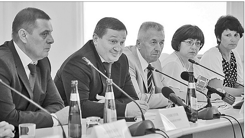
Андрей Бочаров: общение с властью должно быть профессиональным и открытым, а все решения приниматься в диалоге

– Последние годы сложилось такое впечатление, что власть на местах исключительно потребителски относится к бюджету. Все ждут бюджетных денег. Из-за этого нет стимулирования предпринимательства в территориях. Нужны критерии для местной власти, по которым можно будет оценивать ее работу по созданию рабочих мест, доходной части бюджета. Губернатор ответил, что готов рассмотреть это предложение, но попросил предпринимательское сообщество представить «свое видение». Отвечая же на вопрос о дорогах, Андрей Бочаров высказался резко и откровенно. Глава региона рассказал, что еще год назад крупнейшие компании в сфере дорожного строительства и ремонта отказывались работать в Волгоградской области, поскольку регион «имел плохую репутацию». После того, как было приняты меры по созданию нормального «климата», ситуация изменилась. Однако до сих пор многие земли в районе транспортных артерий находятся в частных руках, чтобы построить