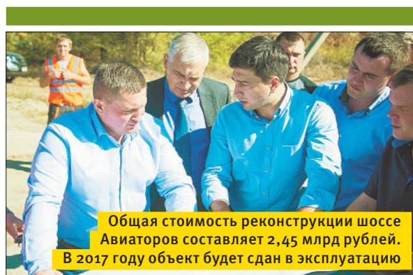
Общая стоимость реконструкции шоссе Авиаторов составляет 2,45 млрд рублей. В 2017 году объект будет сдан в эксплуатацию