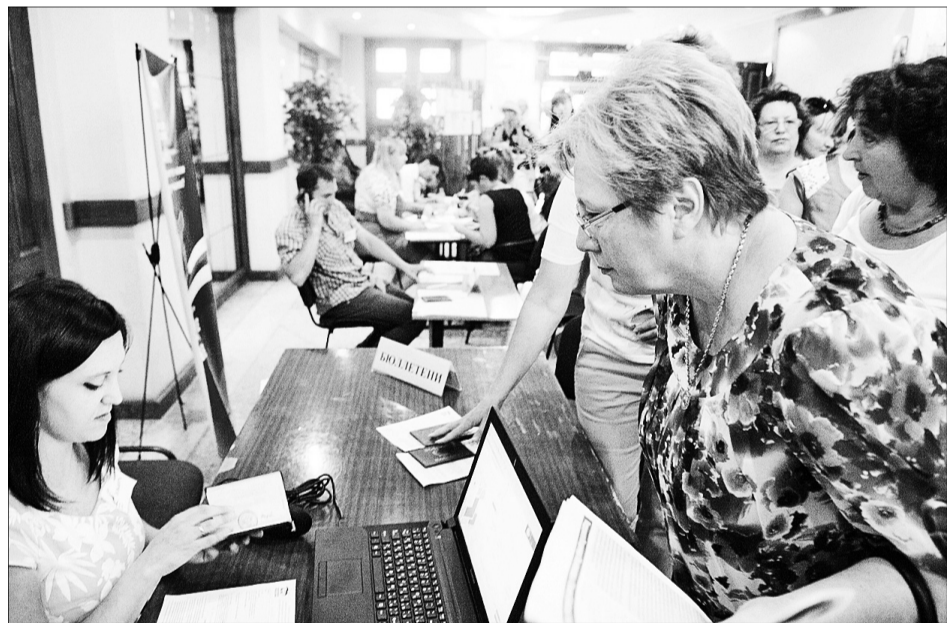
Информированность делает избирателей более активными в политических процессах