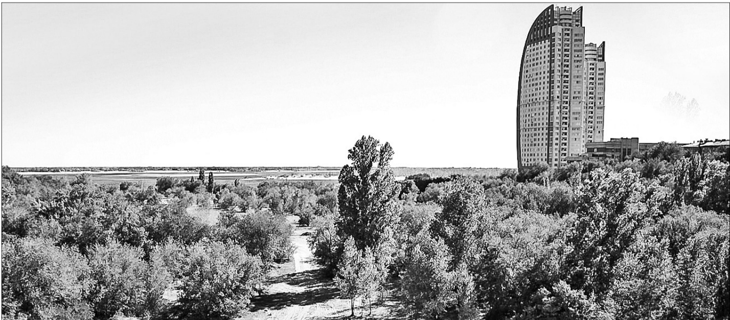
Пока ни один из многочисленных проектов по благоустройству поймы не воплотился в жизнь