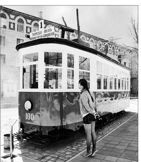
Интересный экспонат привлекает внимание