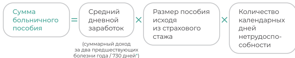
Схема расчета больничного включает в себя пять шагов:

Чтобы рассчитать сумму пособия, нужно умножить среднедневной заработок на количество дней нетрудоспособности и эту сумму умножить на коэффициент продолжительности страхового стажа: