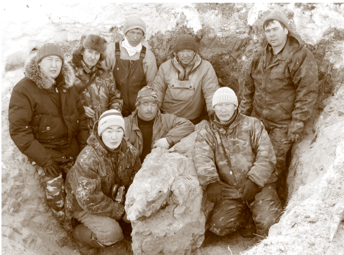
Сотрудник ОПФР и специалисты института прикладной экологии Севера, министерства охраны природы и науки Якутии на раскопках (в центре – останки мамонтенка)