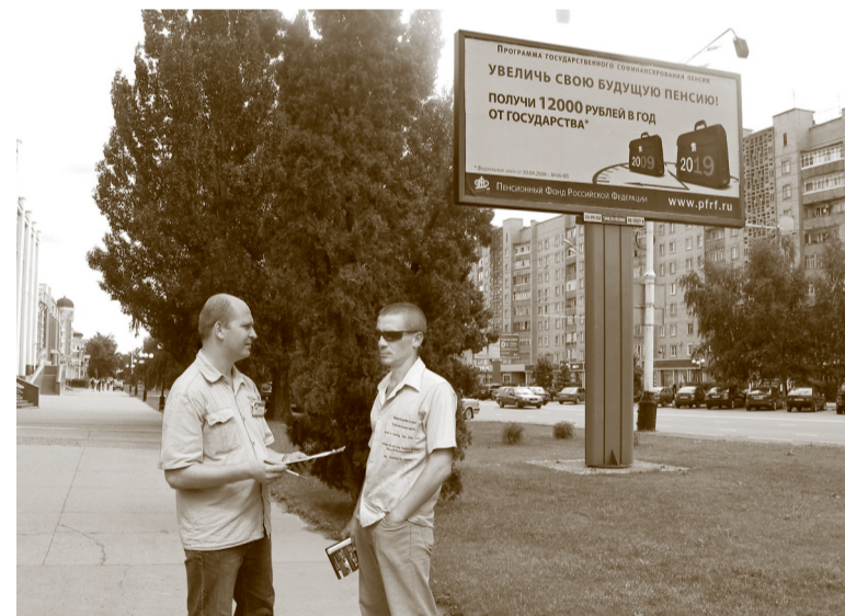
Опрос жителей Тамбова по Программе государственного софинансирования пенсии