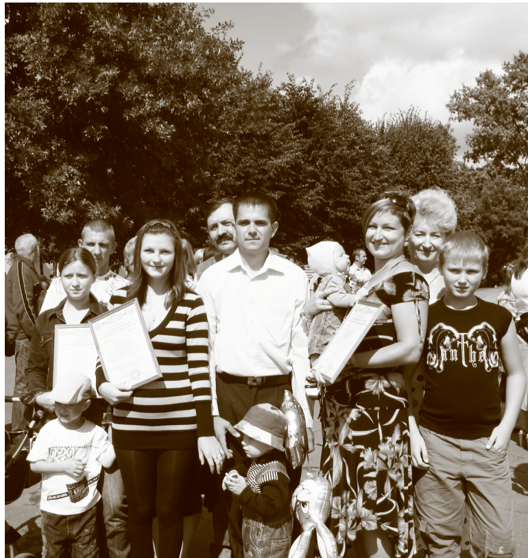
Семьи, получившие сертификат на материнский капитал

Главный редактор Татьяна Милыева Адрес редакции: 119991, Москва, ул. Шаболовка, д.4 e-mail: egvozdzkaaya@100.pfr.ru Тираж: 11 000 экз. Газета выходит ежемесячно.