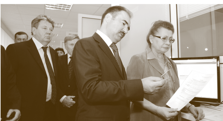
В Уфе Антон Дроздов ознакомился с возможностями социальной карты

Председатель Правления Пенсионного фонда Российской Федерации Антон Дроздов посетил две республики Приволжья – Татарстан и Башкортостан. Оба визита оказались крайне насыщенными и результативными