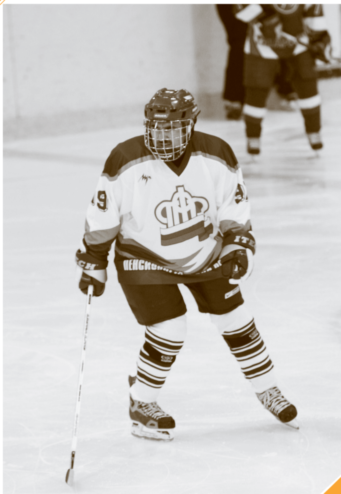
Глава ПФР во время товарищеского матча по хоккею между командами Правительства Республики Татарстан и Пенсионного фонда Российской Федерации. Счет 8:8 (август, г. Казань)

том. Хотя бы раз в неделю выхожу на лед поиграть в хоккей. С детства люблю эту игру.