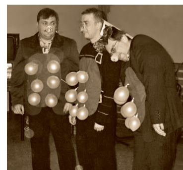
Коллеги-мужчины – настоящие поросята!

Год 2007-й по восточному календарю – год свиньи. Ох, и отпраздновали же его специалисты Управления! Не подумайте плохого. Гостеприимная студенческая столовая