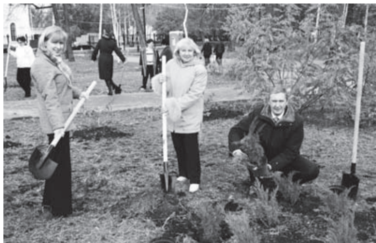
Здесь будет новый парк для жителей Тамбова

регионального отделения Союза пенсионеров России. Главная цель акции – не только сделать отдых горожан лучше, но и напомнить потомкам о вкладе людей старшего поколения в развитие области.