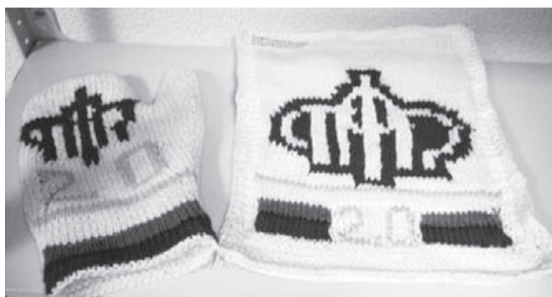
Набор для кухни от Татьяны Тимофеевой из Управления ПФР в Аткарском районе Саратовской области

с помощью техники «торцевание» в Отделении ПФР по Саратовской области на конкурсе «Умелец ПФР». Шедевры достойны восхищения.