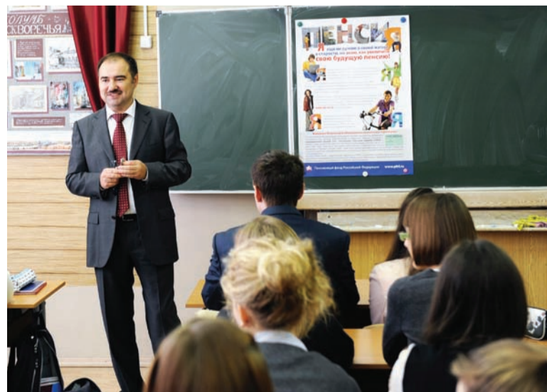
Председатель Правления ПФР Антон Дроздов проводит урок пенсионной грамотности в школе

В конце сентября по всей стране прошли уроки пенсионной грамотности в школах и средних учебных заведениях. Специалисты территориальных отделений ПФР посетили учебные заведения, чтобы рассказать молодежи о пенсионной системе России и о правилах формирования их будущей пенсии.