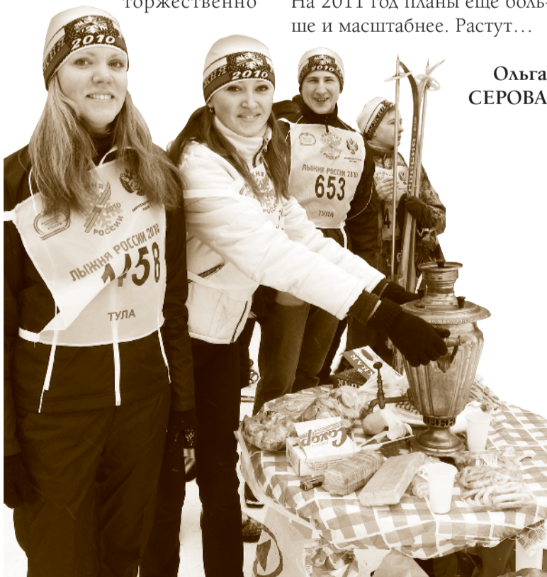
Чай из самовара от САМа для участников спортивного праздника «Лыжня России 2010»