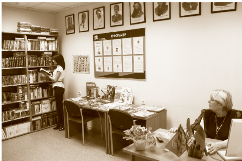
Сотрудники Воронежского ОПФР с удовольствием проводят свободное время в своей библиотеке