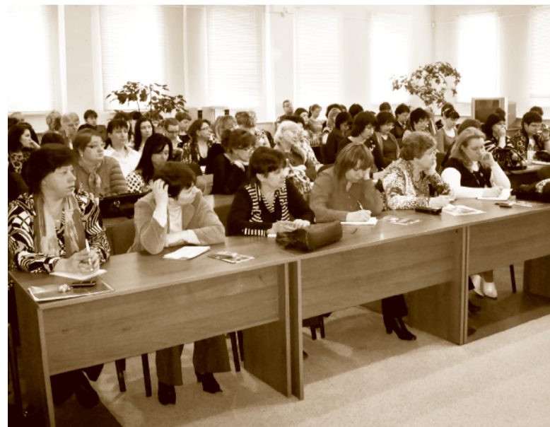
Семинар для страхователей Ярославской области