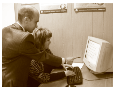
Подготовить отчетность в ПФР страхователь может при содействии консультанта

Теперь страхователь может одновременно сформировать, проверить и представить отчетность в ПФР с рабочего места непосредственно в самом Управлении, применив