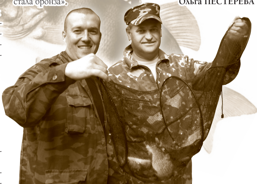
Золотые призеры спортивной рыбалки