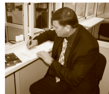
В клиентской службе для работодателей

организаций по созданию условий для уплаты страховых взносов через платежные терминалы, установленные практически во всех крупных торговых и бизнес-центрах.