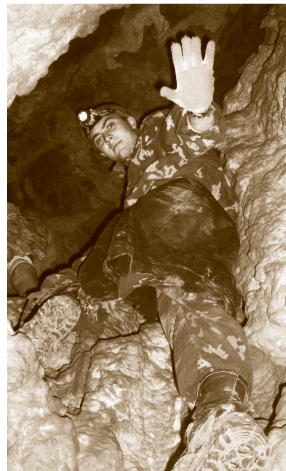
Все выше, и выше, и выше!