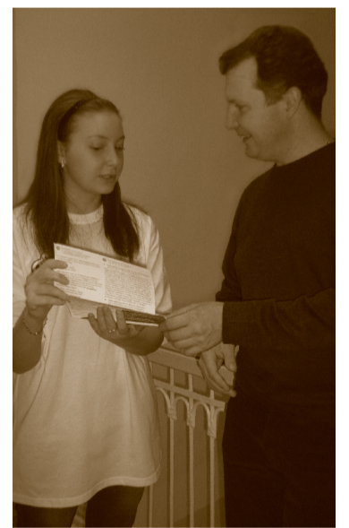
Школьница-волонтер повышает пенсионную грамотность жителя Красноярского края

Школьники-волонтеры со своим проектом «Подумай о своей будущей пенсии!» заняли первое место на отборочном этапе краевого конкурса социальных инициатив «Мой край – мое дело». В ближайшем будущем участники волонтерского отряда жлет