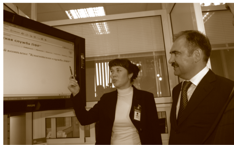
Презентация программно-технического комплекса «Клиентская служба ПФР» Председателю Правления ПФР Антону Дроздову

электронное дело дополняется сканированными документами. Создание базы позволяет на уровне Отделения оперативно контролировать выдачу государственного сертификата и распоряжение его средствами без запроса бумажного дела.