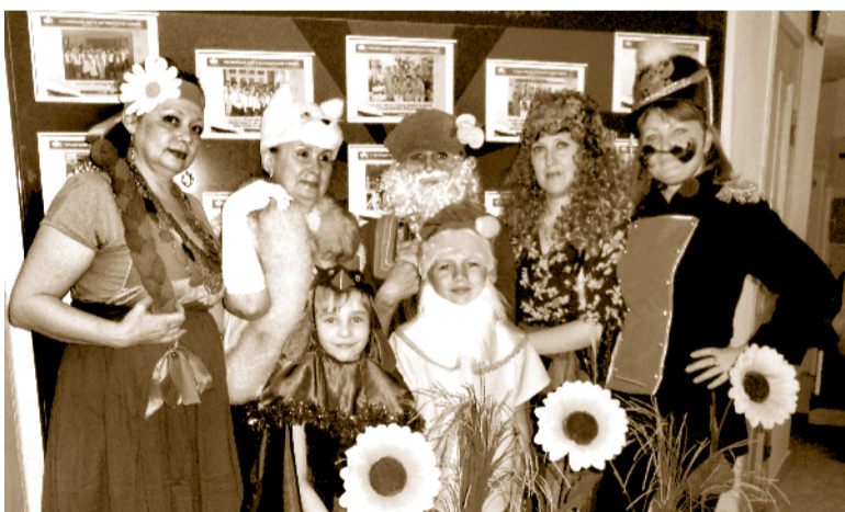
Новые сотрудники ОПФР – не просто специалисты, но и талантливые актеры, режиссеры, танцоры и вокалисты

Новые сотрудники Отделения ПФР по Астраханской области вливаются в рабочий процесс и коллектив творчески