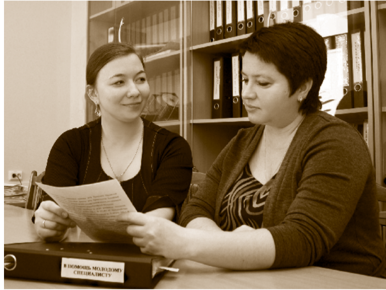
Новый сотрудник и его наставник

– дело техники. Составляется программа и план адаптации, приказ на закрепление наставника, пошаговый отчет. Кстати, в день, когда новичок приступает к работе, на мониторах всех работников управления появляется сообщение: «Сегодня принят новый сотрудник...» В помощь новичкам сформирована «Папка молодого спе-