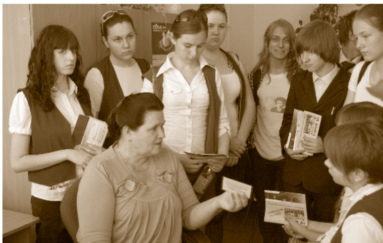
День открытых дверей в Отделении ПФР для выпускников школы

Следующим этапом в пенсионном просвещении населения Пензенской области стала всеобщая подготовка основам пенсионного законодательства руководителей организаций и предприятий всех форм собственности, индивидуальных предпринимателей. Учебная программа рассчитана на 40 академических часов и включает в себя лекции, практические занятия и итоговое тестирование. По результатам успешного окончания учебного пенсионного курса слушателям вручаются сертификаты Правительства Пензенской области. В 2011 году пензенский всеобуч пополнился мероприятиями, проводимыми в рамках федеральной Программы повышения пенсионной грамотности населения.