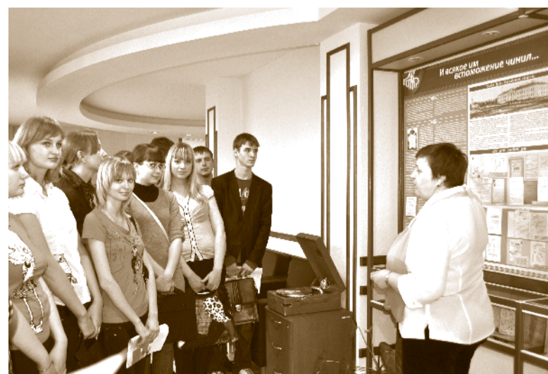
Молодым специалистам рассказывают об истории пенсионного обеспечения в регионе и специфике работы в Пенсионном фонде

В Отделении Пенсионного фонда по Томской области открыта Школа молодого специалиста