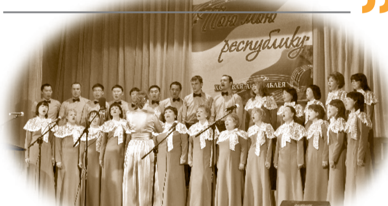
Хор Отделения Пенсионного фонда России по Республике Бурятия