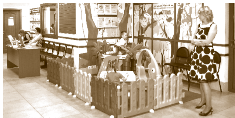
Малышам есть, чем занять себя, пока мама заполняет документы или ожидает приема

” ПОСЕТИТЕЛЬНИЦА КЛИЕНТСКОЙ СЛУЖБЫ: ВНИМАНИЕ К ПОСЕТИТЕЛЯМ С ДЕТЬМИ В «НЕДЕТСКОМ» ГОСУДАРСТВЕННОМ УЧРЕЖДЕНИИ – ЭТО БОЛЬШАЯ РЕДКОСТЬ. ПРИЗНАТЬСЯ ЧЕСТНО, ВПЕРВЫЕ С ТАКИМ СТОЛКУЛАСЬ И БЫЛА ПРИЯТНО УДИВЛЕНА. ”