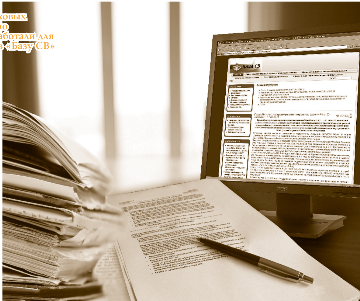
В «Базу СВ» вошел весь комплекс нормативно-правовых документов

Благодаря этим разработкам у специалистов ОПФР отпала необходимость обращаться к информационно-правовым базам «Гарант» и «Консультант». Территориальным органам ОПФР стало значительно легче работать с поступающими обращениями от плательщиков страховых взносов и при проведении выездных проверок.