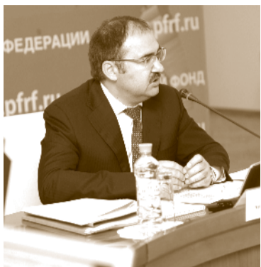
Антон Дроздов о приоритетных задачах ПФР

На заседании Правления была принята Концепция развития автоматизированной информационной системы Пенсионного фонда Российской Федерации до 2016 года. Концепция определяет приоритеты в области информационно-коммуникационных технологий, которые позволят согласованно и скоординировано развивать автома-