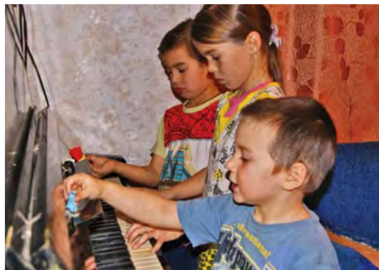
Малыши с удовольствием учатся играть на музыкальных инструментах