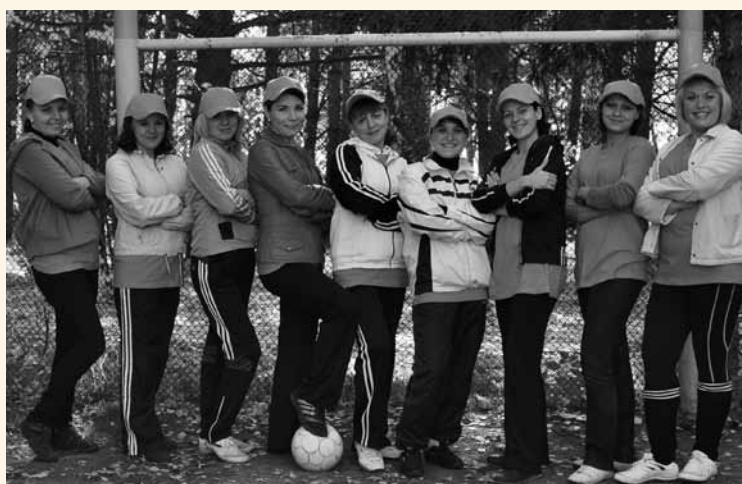
Женская футбольная команда Отделения ПФР по Томской области