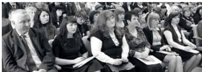
Дни профессиональной подготовки в саратовском ОПФР

кам отделов, их заместителям, кураторам управлений обсуждать наиболее острые проблемы, информировать о новой нормативно-правовой базе, оперативно реагировать на проблемы и недочеты в работе. Иногда на «Дни про-