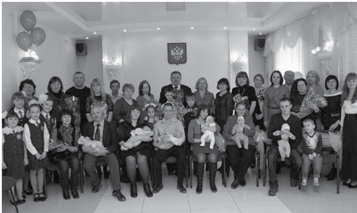
В отделе ЗАГС родителям тройняшек вручают сертификат на материнский (семейный) капитал