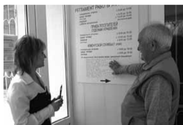
Информация о работе территориального УПФР продублирована шрифтом Брайля

Для сотрудников клиентских служб всех 62 территориальных управлений и Отделения ПФР по Ростовской области были проведены тренинги, обучающие специальным методикам общения с представителями маломобильных групп населения.