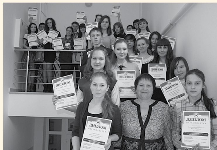
Победителям олимпиады – дипломы и призы