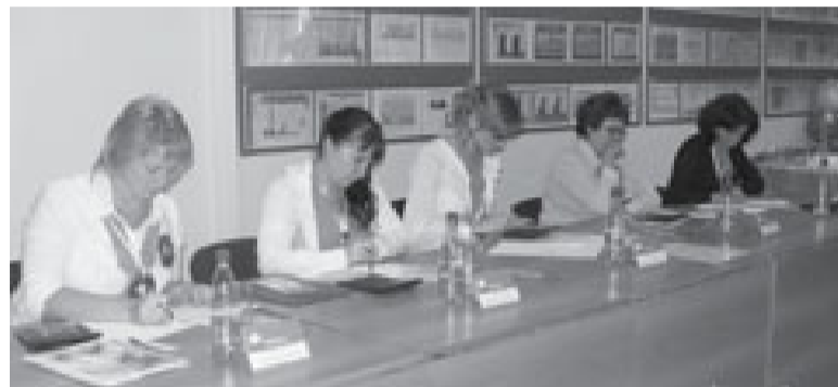
Строгое жюри ОПФР по Курганской области оценивает профессиональное мастерство участников конкурса

Так, в рамках конкурса на звание «Лучший специалист клиентской службы» и «Лучший специалист организации персонифицированного учета» состоялся «Приемный день в клиентской службе», где конкурсанты щедро делились с посетителями своими знаниями по различным темам пенсионного законодательства. Специалисты ка-