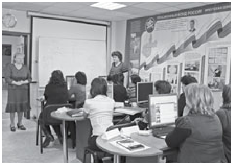
«Ученики» из районных управлений и отделов ПФР Иркутской области

В Отделении ПФР по Иркутской области проходят постоянно действующие курсы повышения квалификации работников районных управлений и отделов ПФР.