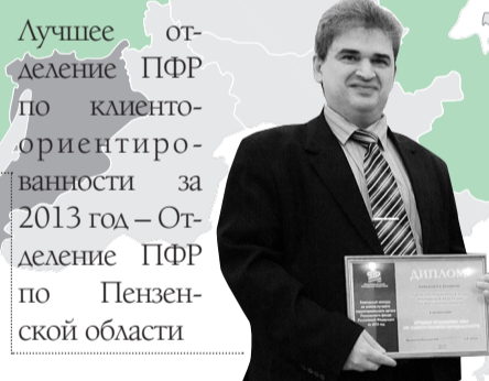
Лучшее отделение ПФР по клиентоориентированности за 2013 год – Отделение ПФР по Пензенской области