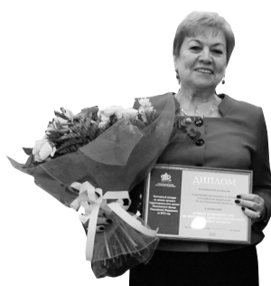
Лучшее отделение ПФР по вопросам администрирования страховых взносов – Отделение ПФР по Астраханской области