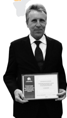
Лучшее отделение ПФР в Южном федеральном округе – Отделение ПФР по Ростовской области