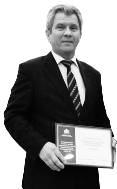
Лучшее отделение ПФР в Центральном федеральном округе – Отделение ПФР по Воронежской области