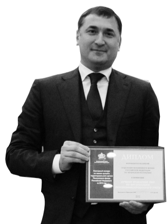
Лучшее отделение ПФР по организации персонализированного учета – Отделение ПФР по Чеченской Республике