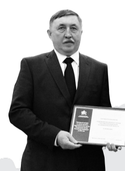
Лучшее отделение ПФР в Северо-Западном федеральном округе – Отделение ПФР по Архангельской области