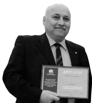
Лучшее отделение ПФР в Северо-Кавказском федеральном округе – Отделение ПФР по Ставропольскому краю