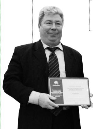
Лучшее отделение ПФР в Уральском федеральном округе – Отделение ПФР по Челябинской области