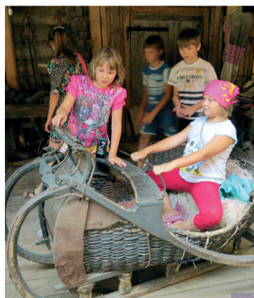
Во время экскурсий самое приятное для детей – возможность потрогать предметы старины

Немало интересного открыли для себя дети сотрудников ОПФР по Пермскому краю. Однако остались еще