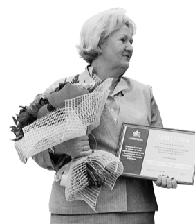
За инновации с использованием информационных технологий – Отделение ПФР по Иркутской области