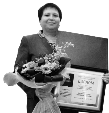
Лидер Пенсионного фонда Российской Федерации – Отделение ПФР по Чувашской Республике – Чувашии