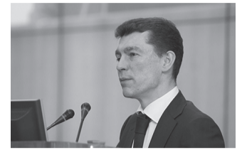
Максим Топилин, Министр труда и социальной защиты Российской Федерации:

В 2013 году Пенсионный фонд России работал в режиме практически ежедневного взаимодействия с министерством, и на это были причины: подготовка, а затем реализация нового пенсионного законодательства. Сотрудники ПФР как Исполнительной дирекции, так и коллеги, которые работают в регионах, принимали в этом самое непосредственное участие. В отличие от прошлых лет, они не только занимались своей стандартной работой – выплатой пенсий и социальных пособий, но и участвовали в этом законодательном процессе. Законопроекты и поправки проходили через руки управляющих отделений ПФР, которые на практике применяют законодательство.