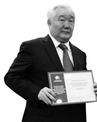
Лучшее отделение ПФР по вопросам организации пенсионного и социального обеспечения – Отделение ПФР по Республике Бурятия