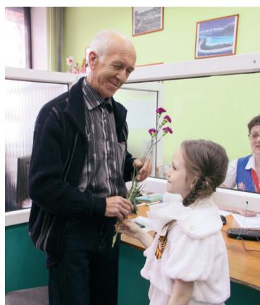
Посетителей одной из клиентских служб Приморского края с Днем Победы поздравили дети сотрудников

Сотрудники Управления уверены, что подобные акции воспитывают в детях трепетное отношение к стар-