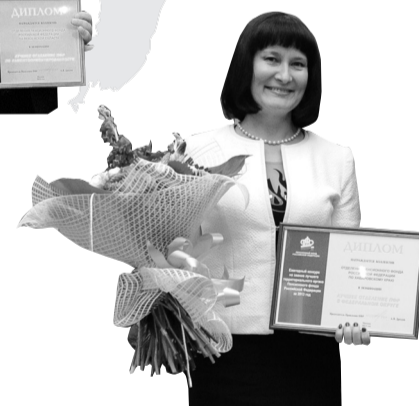
Лучшее отделение ПФР в Дальневосточном федеральном округе – Отделение ПФР по Хабаровскому краю