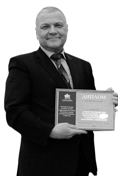
Лучшее отделение ПФР по организации работы, обеспечивающей учет и инвестирование пенсионных накоплений, – Отделение ПФР по Нижегородской области