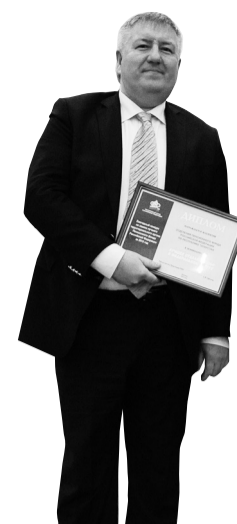
Лучшее отделение ПФР в Приволжском федеральном округе – Отделение ПФР по Республике Татарстан