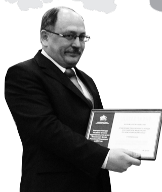
Лучшее отделение ПФР в Сибирском федеральном округе – Отделение ПФР по Красноярскому краю