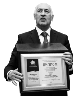
Лидер Пенсионного фонда Российской Федерации – Отделение ПФР по Республике Адыгея