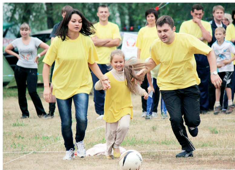
На турслете спортивная семья из ОПФР по Омской области

В обязательном порядке дважды в год – на Новый год и 1 июня – дети и внуки сотрудников посещают театральные спектакли. Конечно, и в течение года в каждом территориальном управлении проводится много мероприятий для ребят: конкурсы, выставки детского творчества, игры на свежем воздухе, походы в