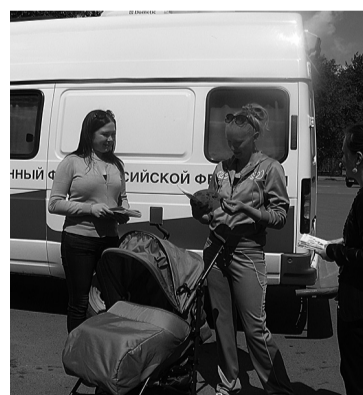
В мобильной клиентской службе все расскажут, все покажут

контакт-центры. Позвонив операторам центров, зауральцы также спокойно могут проконсультироваться по любому вопросу и заказать необходимые документы. В 2013 году в контакт-центр г. Кургана обратилось свыше 41 тыс. человек. Кроме того, в настоящее время во всех территориальных органах ПФР Курганской области в опытной эксплуатации находится программный ком-