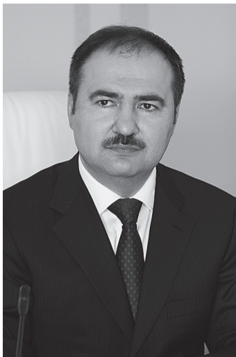
Антон Дроздов, глава ПФР:

Стратегия развития пенсионной системы в РФ до 2030 года, принятая Правительством РФ, устанавливает определенные целевые ориентиры, которые должны быть достигнуты к концу указанного периода.