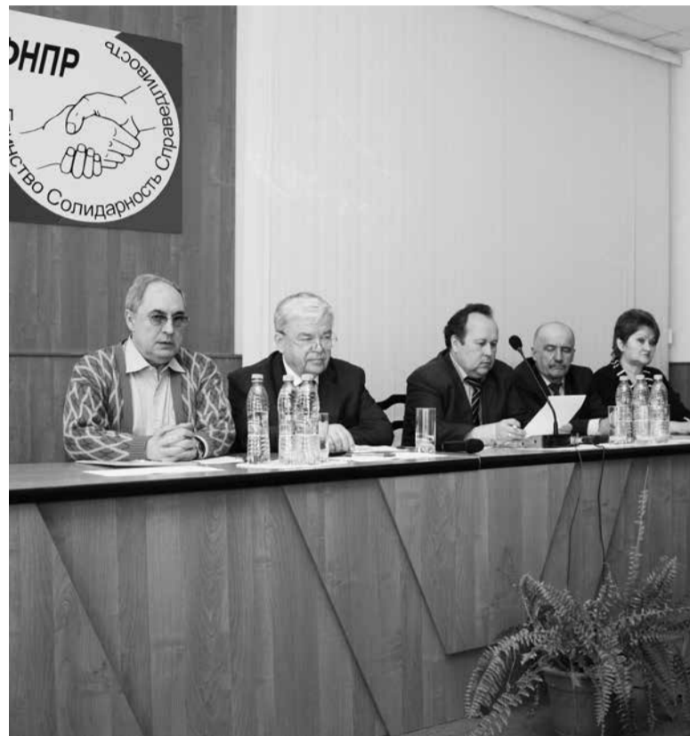
Круглый стол с руководителями 70 профсоюзных организаций Республики Марий Эл

В Отделении ПФР по Республике Марий Эл пенсионный всеобуч по новой пенсионной формуле начали с профсоюзных лидеров.