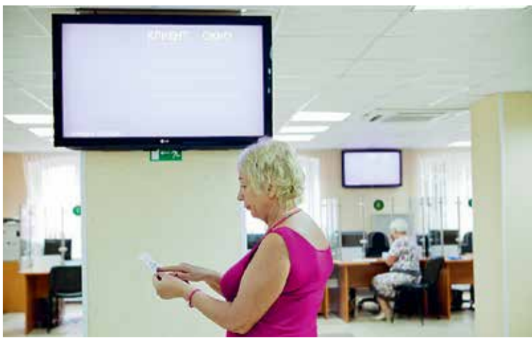
На прием к специалисту клиентской службы ПФР через электронную очередь