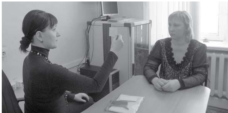
Работа с острым стрессом требует высокой квалификации и ответственности