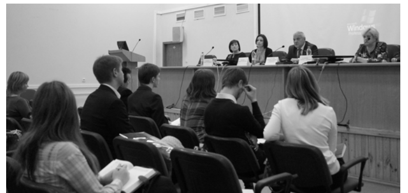
Образовательный семинар в Отделении ПФР по Нижегородской области по теме «Новая пенсионная формула» для представителей Молодежного парламента

Так, в апреле 2015 года представители Молодежного парламента совместно со специалистами Пенсионного фонда посетили областной колледж культуры, где представили ребятам интерактивную игру. В ходе игры выяснилось, что почти все присутствующие выбрали белую зарплату.