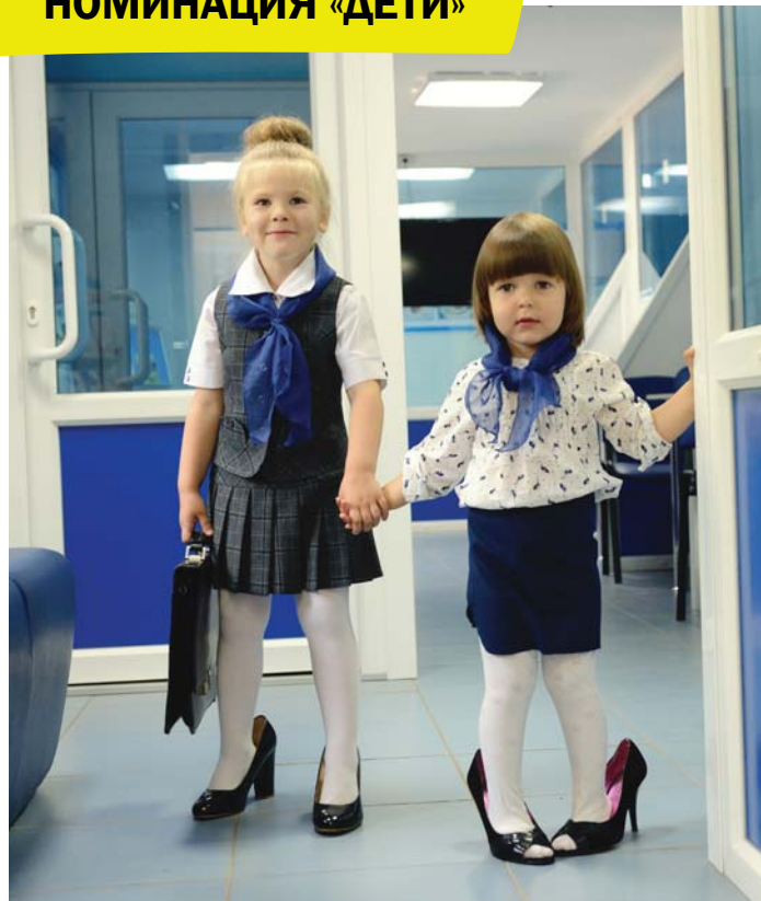
Автор фотографии «Хочу работать в ПФР!» – Татьяна Аникина, начальник отдела ПФР по Кологривскому району УПФР в г. Мантурово Костромской области

Были определены несколько номинаций: «Дети», «Наши клиенты», «Наши сотрудники» и «Мир моими глазами». А так как главными в работе сотрудников ПФР являются клиенты, то в соответствующей номинации было выбрано несколько победителей.