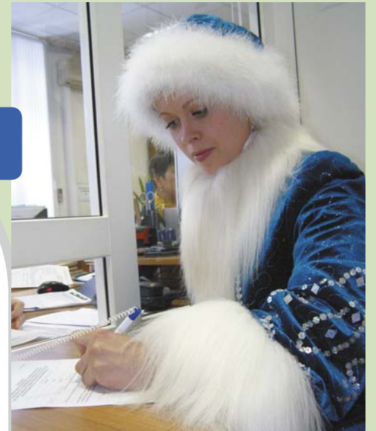
Костромская Снегурочка подает заявление о вступлении в Программу государственного софинансирования пенсий