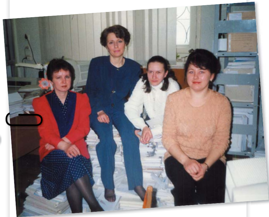
Специалисты УПФР в г. Новоуральске Свердловской области сидят на стопках деклараций из ФНС