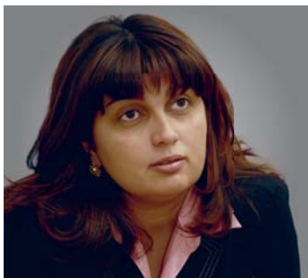
Мargarita Нагога, начальник Департамента общественных связей и взаимодействия со СМИ ПФР:

Владелец сертификата на материнский капитал обращается в территориальный орган Пенсионного фонда по месту жительства (пребывания) или фактического проживания, в том числе через МФЦ, за компенсацией расходов на приобретенные товары или услуги, предоставив необходимые документы, в том числе платежные.