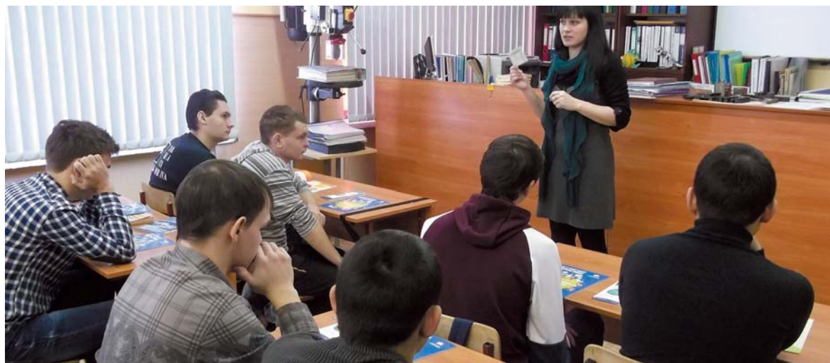
Лекция по повышению пенсионной грамотности для учащихся Волжского промышленно-технологического техникума

В 2010 году к нам в школу на встречу пришли специалисты Управления ПФР по Поворинскому району с рассказом о работе органов ПФР. Меня это заинтересовало, и уже не было никаких сомнений, куда идти учиться и какую профессию получать.