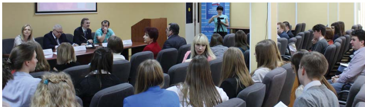
Дебаты по теме материнского капитала с участием студентов вузов в Республике Карелия

ПФР принимает в ряды своих сотрудников молодых специалистов, недавно окончивших институт. Как работодатель Фонд приветствует практику привлечения таких кадров и уже заранее ведет активное взаимодействие с вузами, направленное на профориентационное воспитание студентов: заключает соглашения, проводит лекции и игровые тренинги. Несмотря на отсутствие прописанного требования к опыту работы для кандидатов на «младшие» должности, Пенсионный фонд России обучает студентов и приглашает их занять вакантные места в системе ПФР.