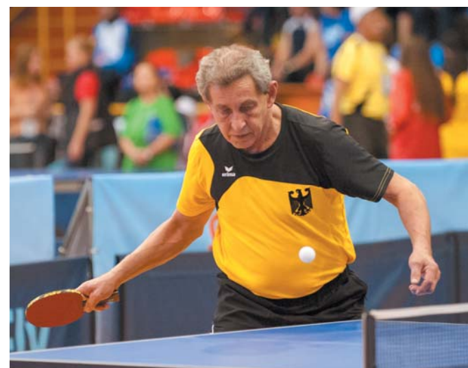
Павел Шлее, Германия. Настольный теннис