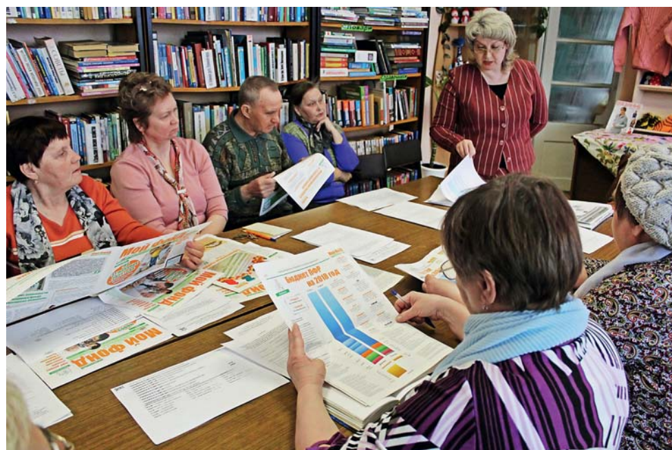
УПФР в Еловском районе Пермского края

Во время мероприятий представители Управления рассказывают о нововведениях по вопросам пенсионного обеспечения. Встречи с населением проходят либо в официальной форме, либо в непринужденной